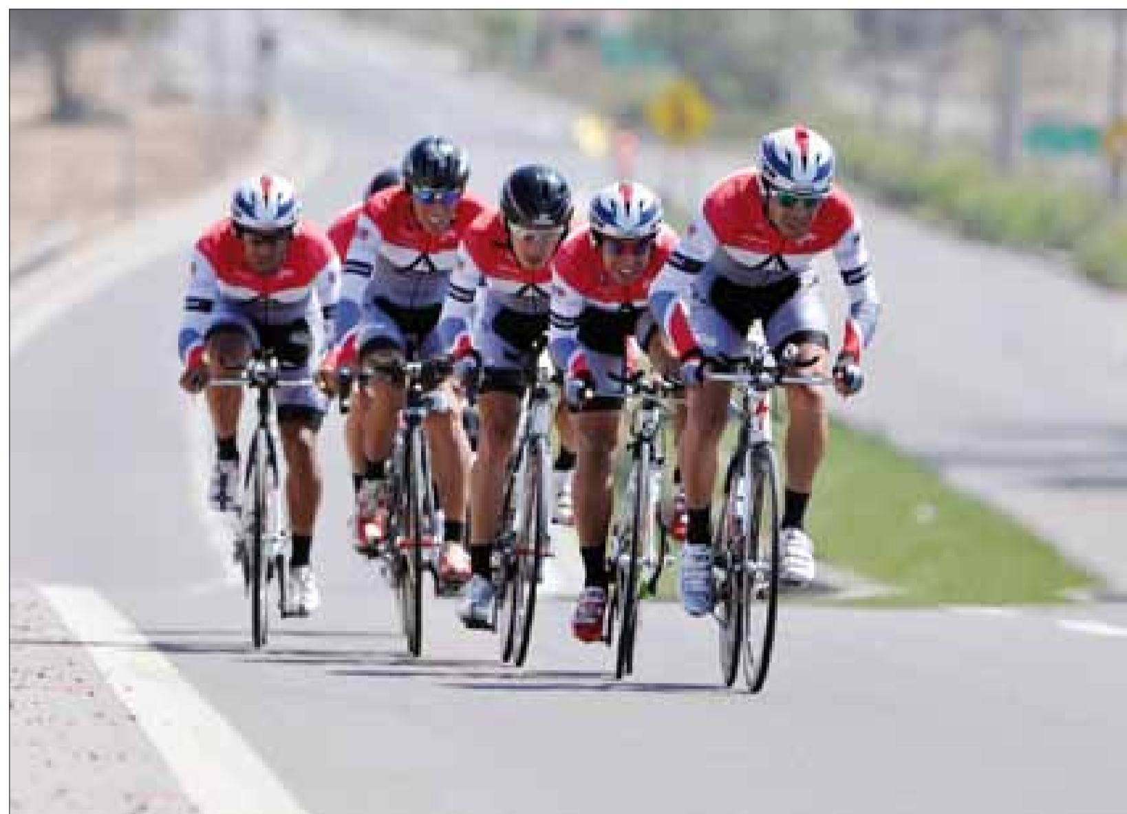
Contra reloj en Arica, equipo ARQ-USM. Prólogo Vuelta a Chile 2012.