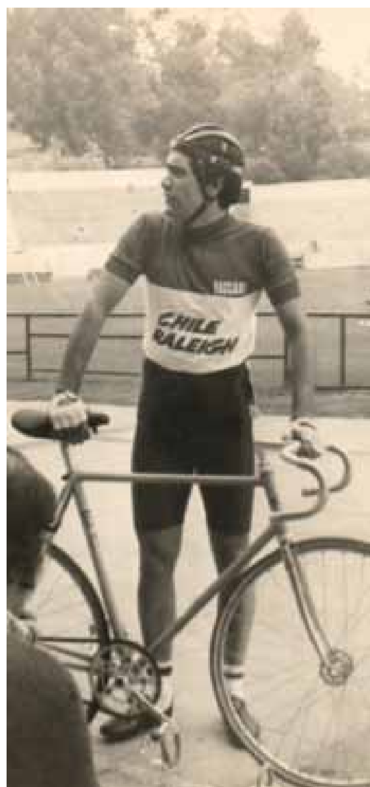
Verano 1981. Temporada de pista Velódromo Sausalito.

Hoy nos muestra, en el MURO/GALERÍA, una selección de imágenes de algunas bicicletas emblemáticas en la historia de este bello objeto de diseño.