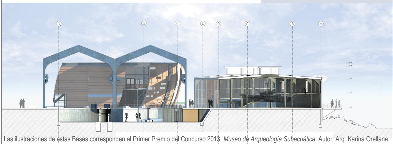
Las ilustraciones de estas Bases corresponden al Primer Premio del Concurso 2013, Museo de Arqueología Subacuática . Autor: Arq. Karina Orellana